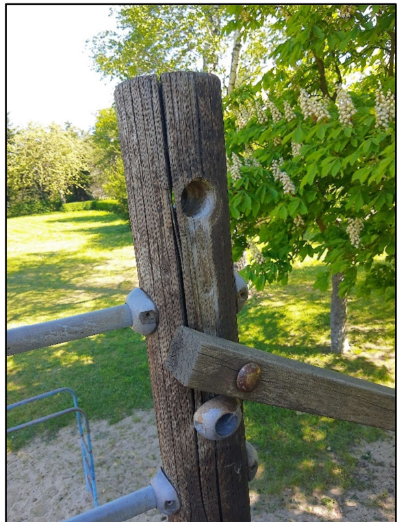
Baulicher Zustand Rutschenturm