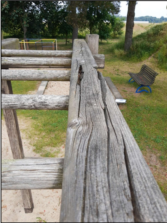
Baulicher Zustand Kletterkombination