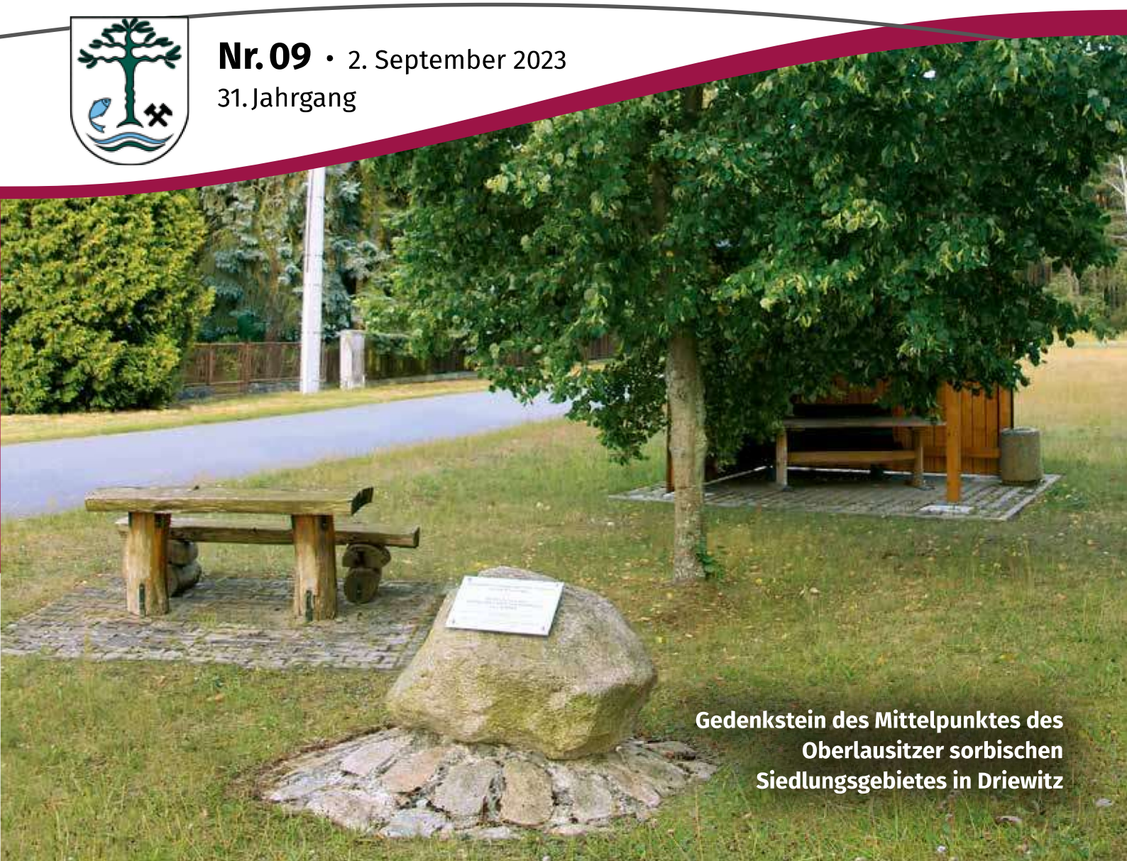
Gedenkstein des Mittelpunktes des Oberlausitzer sorbischen Siedlungsgebietes in Driewitz