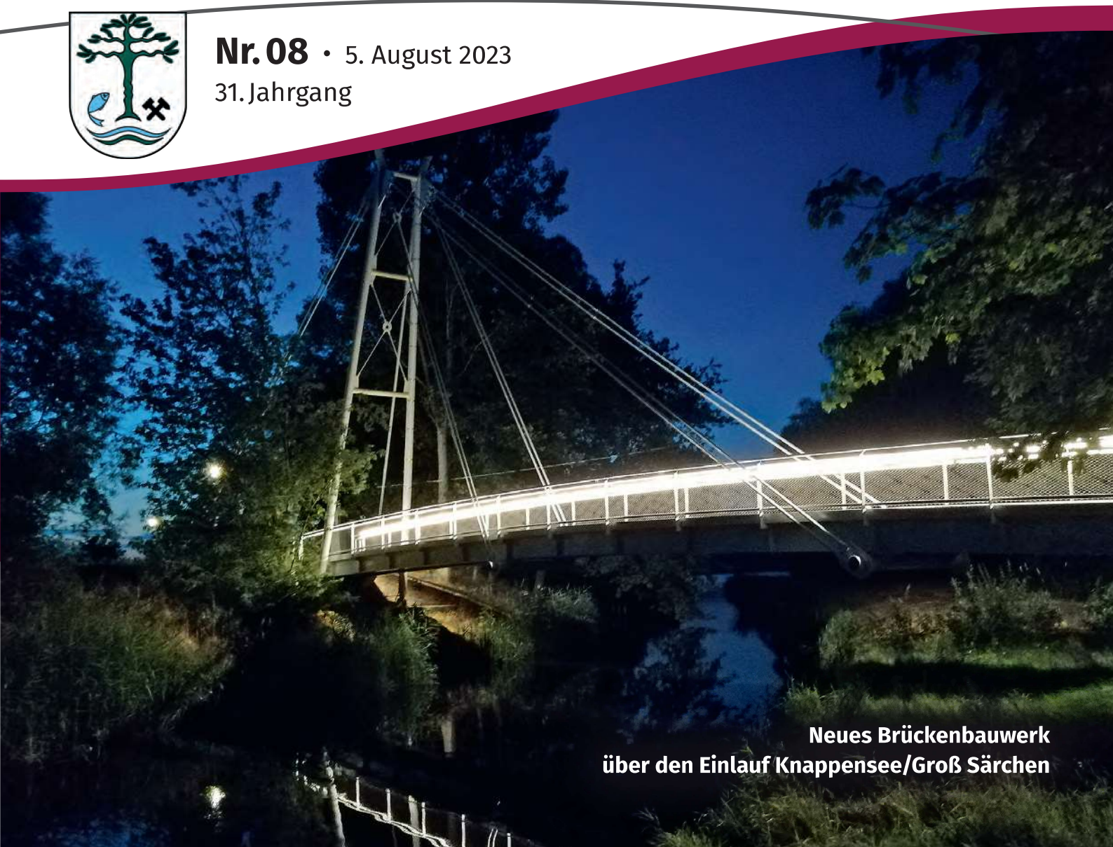
Neues Brückenbauwerk über den Einlauf Knappensee/Groß Särchen